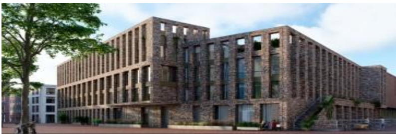
Woningen op het Kerkplein

De vereniging heeft ten doel het bevorderen en in stand houden van het stadsschoon en de monumentale en landschappelijke waarden in de gemeente Arnhem, in de meest ruime zin.